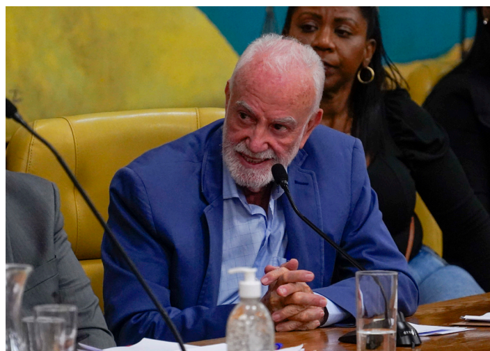
Em março deste ano, o mandato realizou seminário sobre a revisão do Plano Diretor Estratégico (PDE)