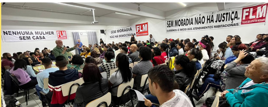
Encontro Semanal com a companheirada da Frente de Luta por Moradia (FLM)

Em nossa história nunca possuímos políticas públicas habitacionais dos três entes federados. Propomos, então, a união dos esforços, combinando o implemento dos três programas de moradia articulados na cidade de São Paulo. Podemos refor-