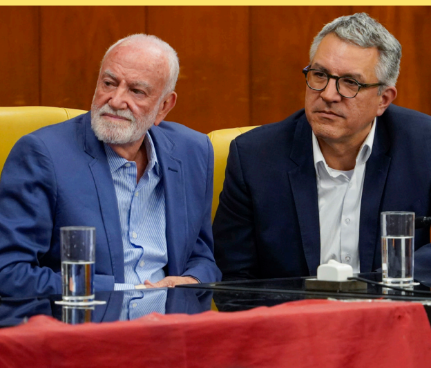
Na cerimônia de posse do mandato, com o Ministro de Relações Institucionais da Presidência da República, Alexandre Padilha

A lei é apenas isto: "Ama o teu irmão como a ti próprio". (Mateus 22:37-39)